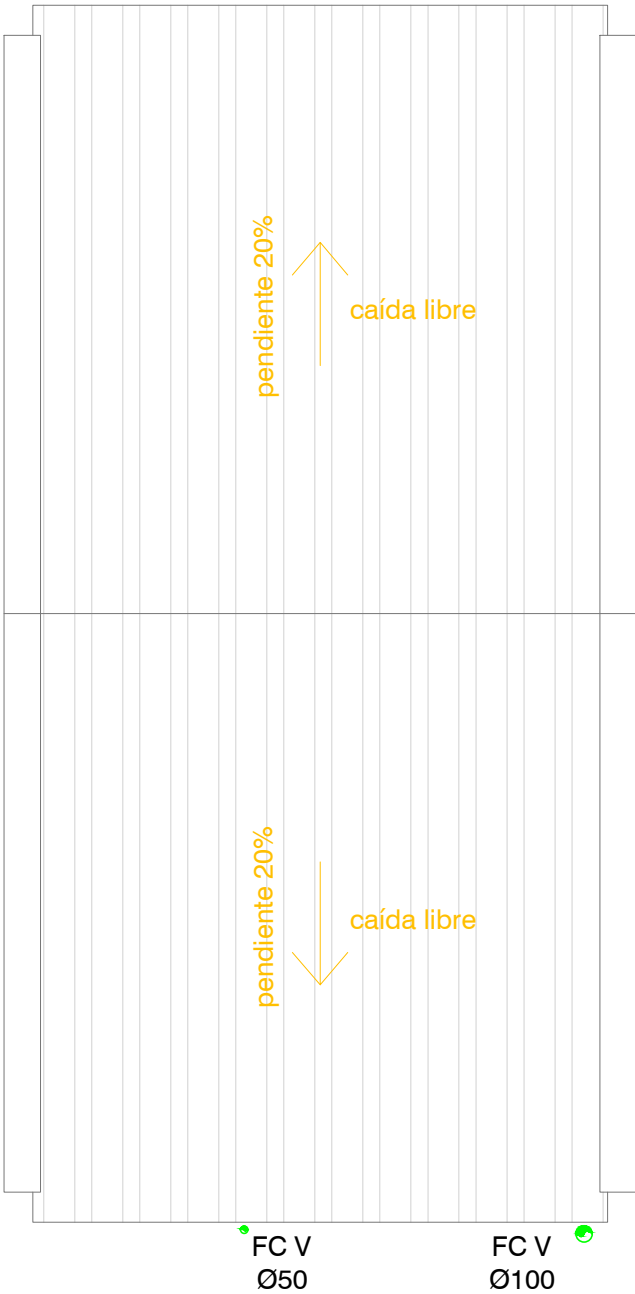
2N 3D der